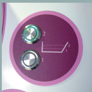
Arrêt auto de remplissage 2 niveaux