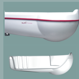
Cuve à fond plât TS