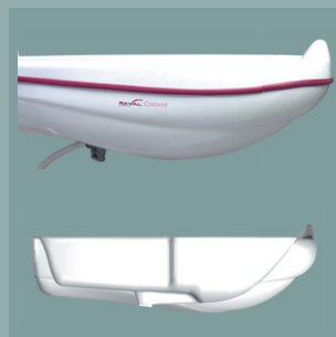
Cuve ergonomique R'GO