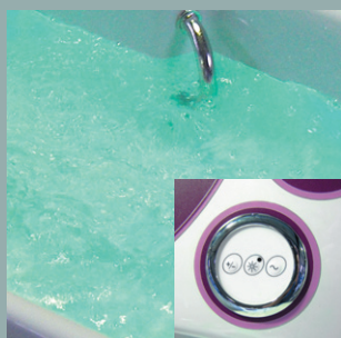
Bain bouillonnant à air