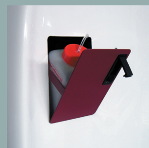
Système de désinfection